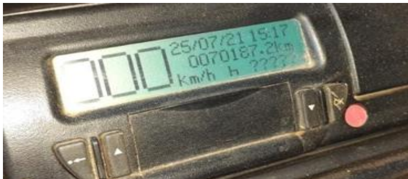
Figura 03: tacógrafo de monitoramento de distancia percorrida caminhão Ford 816 – S.

Na figura 03, observa-se que atualmente o veículo está com 70.187,2/km rodados, ou seja, ainda faltando 12.596,8 km para nova troca.