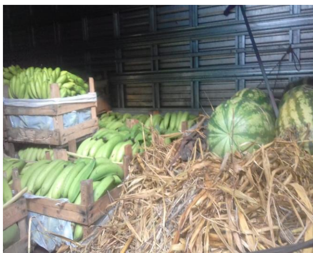
Figura 06 (esquerda): produtos vegetais para atender o mercado convencional.