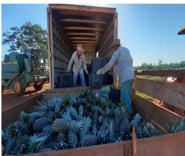
Figura 04 (esquerda): captação de produtos para entrega no PNAE em Barra do Bugres. Figura 05 (direita): abacaxis entregue no PNAE em Barra do Bugres.

No mês de junho foram percorridos 1011,3 km em 07 (sete) viagens, sendo que 06 (seis) viagens foram destinadas especificamente para atendimento do fornecimento de rações.