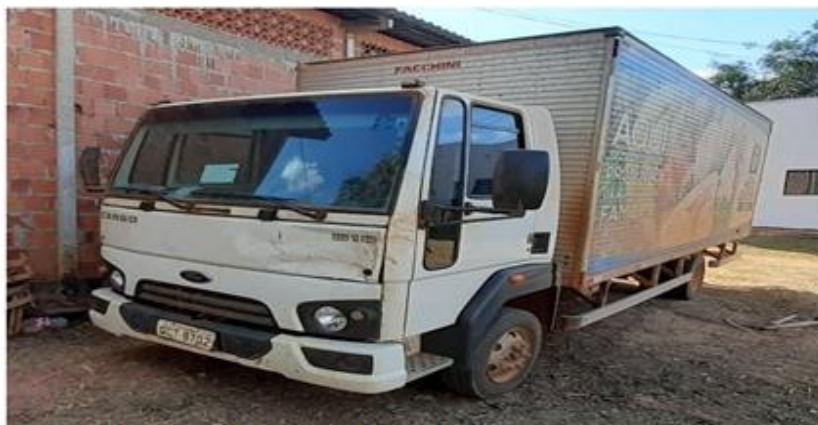
Figura 01: caminhão baú Ford 816-S